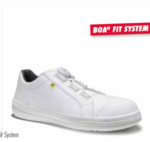
BOA® Fit System